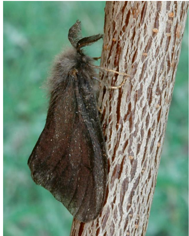
Abb. 4: Männchen von Canephora hirsuta (PODA, 1761) vom Teufelslauch im NSG „Unteres Schlaubetal“, Landkreis Oder-Spree, Brandenburg.