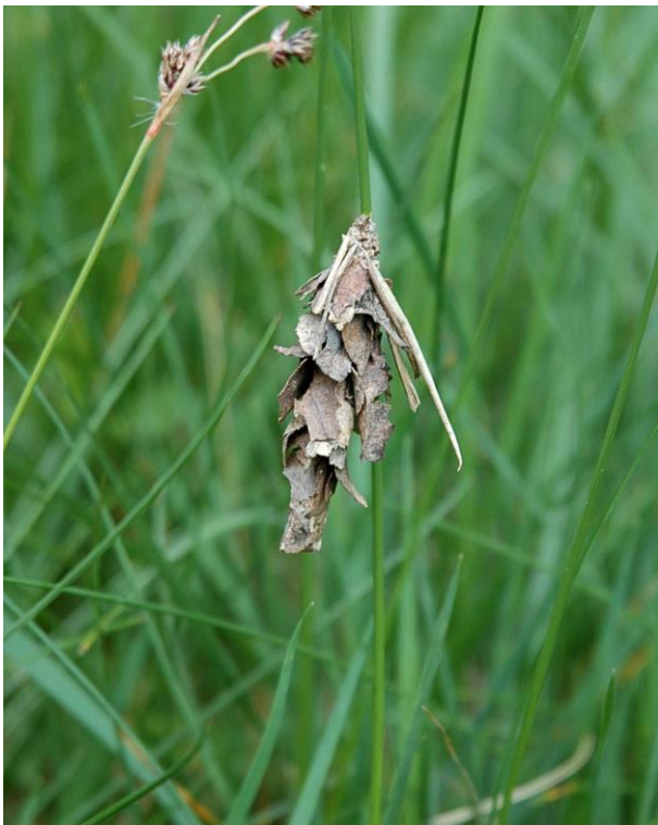
Abb. 5: Männlicher Sack von Canephora hirsuta (PODA, 1761) im NSG „Oberes Demnitztal“, Landkreis Oder-Spree, Brandenburg.