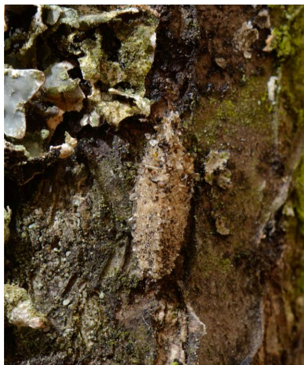
Abb. 2: Sack von Dahlica triquetrella (HÜBNER, 1813) (parth. form) im NSG „Müggelsee und Fredersdorfer Mühlenfließ“, Umg. Krötenteich bei Rahnsdorf.