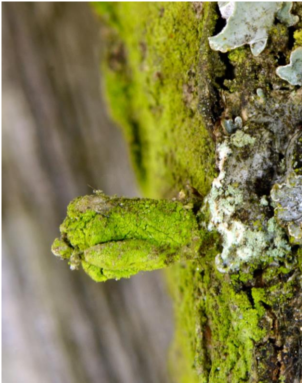
Abb. 3: Vorjähriger, stark mit Algen überzogener Sack von Bacotia claustrella (BRUAND, 1845), Müggelberge, Kämmerei-Heide in Köpenick.